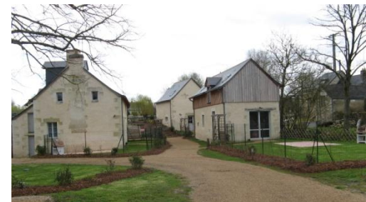
Gîtes du moulin à eau de la commune

Vous tournerez à gauche avant d'atteindre la D186 et après 600 mètres encore une fois à gauche jusqu'au carrefour des barrières blanches que vous traverserez tout droit. Au carrefour des chevreaux, vous tournerez à gauche. Puis à la côte de 96 mètres de « La Bute Ronde », il ne vous restera plus que 1400 mètres pour revenir au village (à l'altitude de 58 mètres).