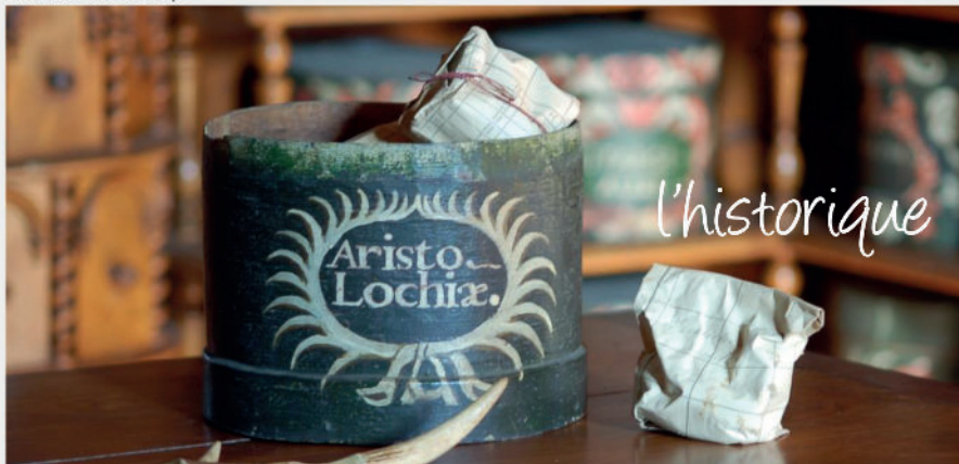
APOTHECAIRE DE BAUGÉ