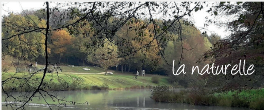
PLAN D'EAU DE BAUGÉ