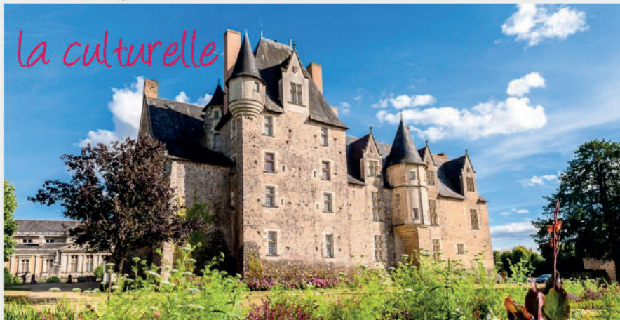
CHÂTEAU DE BAUGÉ