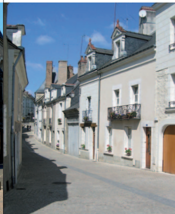
RUE BASSE DE L'ÉCU

sur d'étroites parcelles d'origines médiévales. En descendant cette rue, observez l' ancienne auberge de l'Écu de France , (N°23) édifée en 1615, qui servit de relais de la poste à cheval jusqu'à l'arrivée du chemin de fer en 1887. Puis la petite maison-à-pans de bois des XV e -XVI e (N°24), l' ancienne boulangerie Cointereau (1614, N°19), ancêtre de la famille Cointreau (liqueurs), et au N°11 le logis XVI e avec son balcon en fer forgé (XVIII e ) représentant les outils du tanneur, emblèmes de la famille propriétaire de la maison avant la Révolution.