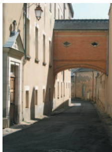
LE PONT VOLANT

Continuez vers la rue Victor Hugo, traversez et rendez-vous rue de la Girouardière . C'est l'une des plus anciennes rues de la ville, elle conduisait aux grands jardins du roi René et à la chapelle Notre-Dame du Petit Puy, aujourd'hui disparus. Cette rue est dédiée à Anne de la Girouardière, issue de la noblesse française et fondatrice des Incurables au XVIII e siècle avec l'Abbé Berrault. Continuez sous le pont "volant" , construit avec l'autorisation de Napoléon I er , alors à Moscou, en 1812. Ce pont permettait de relier le premier hospice de la Girouardière (à droite) à son annexe.