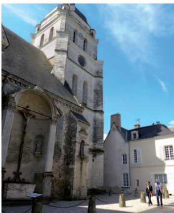
ÉGLISE SAINT-PIERRE & SAINT-LAURENT

monumental pour les voitures à cheval et cour intérieure donnant sur le logis.