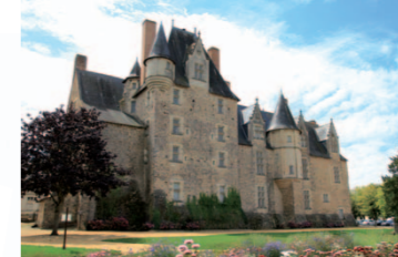
FAÇADE NORD DU CHÂTEAU

Départ : château de Baugé. Le roi René fit bâtir le château au milieu du XV e siècle pour en faire son relais de chasse. De style pré-Renaissance, il s'agit d'une demeure de plaisance. Il n'a pas été pensé comme édifice militaire même si quelques archères et canonnières sont encore visibles sur la façade nord. C'était une des résidences favorites du roi René car c'est la seule qu'il ait fait construire. Remanié plusieurs fois au cours des siècles, les volumes du XV e restent encore visibles. Aujourd'hui, l'étonnant parcours-spectacle intérieur vous invite à l'époque du roi René. En contournant le château, vous découvrirez le dédalus et le jardin bouquetier plantés en souvenir de René d'Anjou, passionné de botanique.