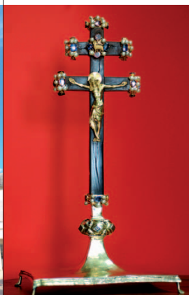
RELIQUAIRE DE LA CROIX D'ANJOU

Passez devant le magnifique hôtel particulier du XVIII e (N°15), avec jardin en terrasse donnant sur la vallée du Couasnon, où vécut Lemaignan des Boiseries, premier sous-préfet de Baugé. A droite (N°28) remarquez la maison à pans-de-bois et son inscription protestante datée de 1561 : " On a beau sa maison bastir, si le seigneur n'y met la main, ce n'est que bastir en vain ". A gauche, au N°21, admirez la porte d'entrée (1741) du gracieux logis du XV e ayant appartenu à Guy de Laval, Grand Maître des Eaux et Forêts d'Anjou. C'est dans le vaste hôtel des N°23 et 25 qu'habitait l'accusateur public auprès du tribunal du district. Au N°29 l'arquebusier Trépeau réalisa le balcon en fer forgé.