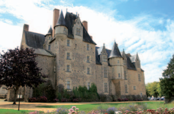
FAÇADE NORD DU CHÂTEAU

Départ : château de Baugé. Le roi René fit bâtir le château au milieu du XV e siècle pour en faire son relais de chasse. De style pré-Renaissance, il s'agit d'une demeure de plaisance. Il n'a pas été pensé comme édifice militaire même si quelques archères et canonnières sont encore visibles sur la façade nord. C'était une des résidences favorites du roi René car c'est la seule qu'il ait fait construire. Remanié plusieurs fois au cours des siècles, les volumes du XV e restent encore visibles. Aujourd'hui, l'étonnant parcours-spectacle intérieur vous invite à l'époque du roi René. En contournant le château, vous découvrirez le dédalus et le jardin bouquetier plantés en souvenir de René d'Anjou, passionné de botanique.