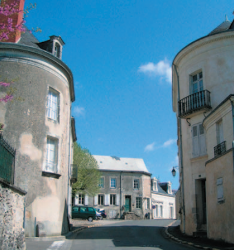
ANCIENNE PORTE SAINT- NICOLAS

9 tours et une seule porte dont la partie haute fut abattue en 1846. Revenez sur vos pas, vers la place du Marché et au passage, sur votre droite, vous pourrez voir au N° 31 ce curieux logis du XVI e à pignons jumelés .