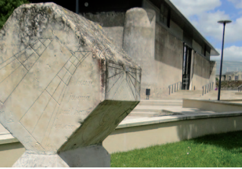
LE CADRAN SOLAIRE

Déambulez jusqu'à la mairie; vous apercevez en face un objet totalement insolite : un cadran solaire à huit faces. Sur un bloc de calcaire monolithique de 140 kg, un autodidacte baugeois, M. Bariller, a réalisé en 1834 le travail exceptionnel de graver huit types de cadrans solaires élémentaires, tous opérationnels. C'est sans doute une pièce unique en France.