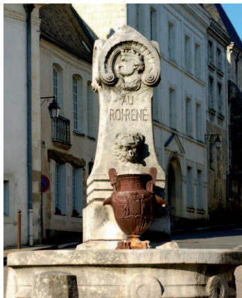
PLACE DU ROI RENÉ, LA FONTAINE

Cette rue est l'artère principale de la ville avec, dans son prolongement, la rue Victor Hugo, construite en surélévation au XIX e . Vous pouvez y remarquer de beaux balcons.