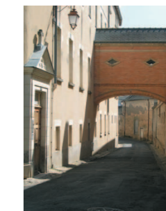
LE PONT VOLANT

Continuez vers la rue Victor Hugo, traversez et rendez-vous rue de la Girouardière . C'est l'une des plus anciennes rues de la ville, elle conduisait aux grands jardins du roi René et à la chapelle Notre-Dame du Petit Puy, aujourd'hui disparus. Cette rue est dédiée à Anne de la Girouardière, issue de la noblesse française et fondatrice des Incurables au XVIII e siècle avec l'Abbé Berrault. Continuez sous le pont "volant" , construit avec l'autorisation de Napoléon I er , alors à Moscou, en 1812. Ce pont permettait de relier le premier hospice de la Girouardière (à droite) à son annexe.