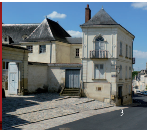
PLACE DE LA CROIX ORÉE

Englobée au XVI e par la nouvelle enceinte, la place de la croix Orée marquait auparavant les limites de la cité médiévale. Autour de cette place, l' hôtel le Broc (N°3) a été donné par Mademoiselle de Hargues à la congrégation des Sœurs de Saint François. Au N°2 le logis du XVI e , flanqué d'une tourelle, abritait le Jeu de Paume. Au N°1 l' hôtel de la Morellière , du XVI e , présente un porche de 1765. Allez au N°3 de la rue Saint Nicolas et retournez-vous. Vous découvrirez l'emplacement de l' ancienne porte Saint-Nicolas . C'est en 1539 que François I er autorisa de reparer la ville. Baugé était alors cernée par 1290 mètres de murailles, 15 tours de guet et 4 portes d'accès. Il ne subsiste aujourd'hui que 400 mètres de remparts,