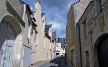
RUE DE LA GIROUARDIÈRE