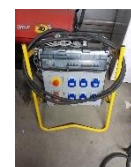
Coffret TRI PHASÉ

Si oui, merci de nous préciser la liste du matériel à brancher et la puissance électrique :