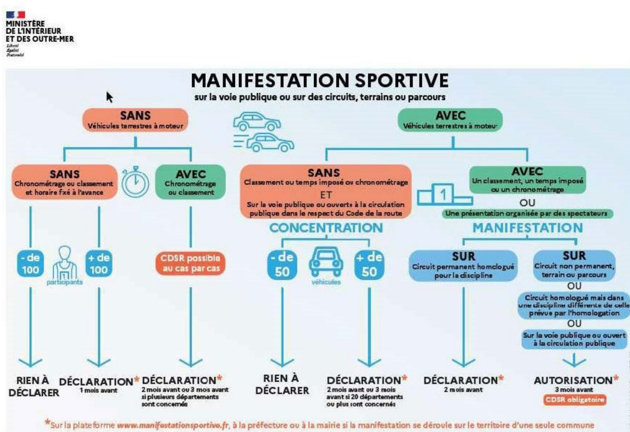
Schéma récapitulatif de déclaration en fonction de la manifestation sportive :

L'organisateur doit veiller à déposer les éléments demandés dans les rubriques adéquates lors du dépôt du dossier.