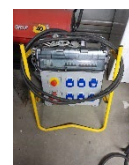
Coffret TRI PHASÉ

Si oui, merci de nous préciser la liste du matériel à brancher et la puissance électrique :